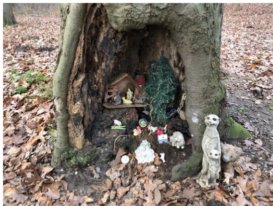
kerststal in een holle boom bij Het Joppe (Gorsel) december 2020